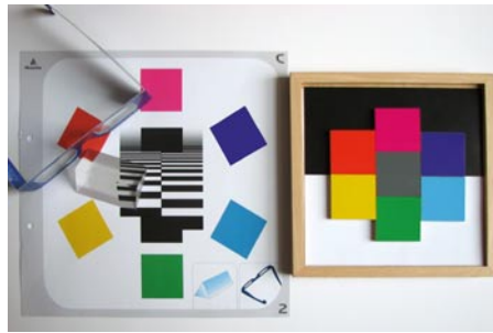
III.10.02 Prismenvorlage und 16er-Legerahmen III.10.03 Legestein-Sortiment (Graureihe und 48 Farbsteine in den Qualitätsstufen hk, v, dk, tr)